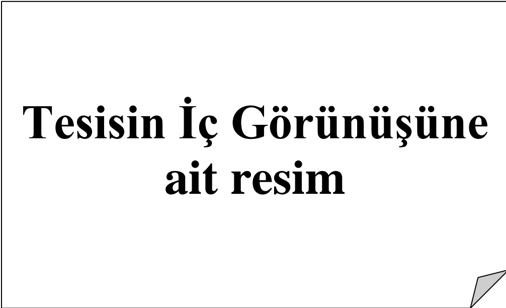
Resim 1.4 Tesisin İç Görünüşü 2