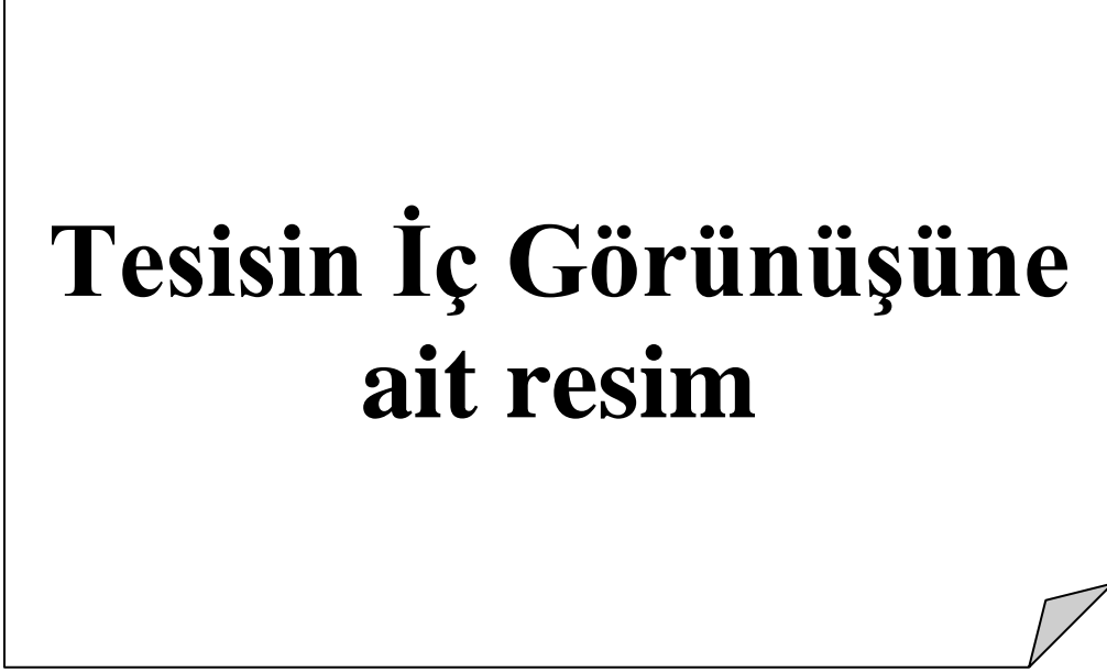
Resim 1.3 Tesisin İç Görünüşü 1