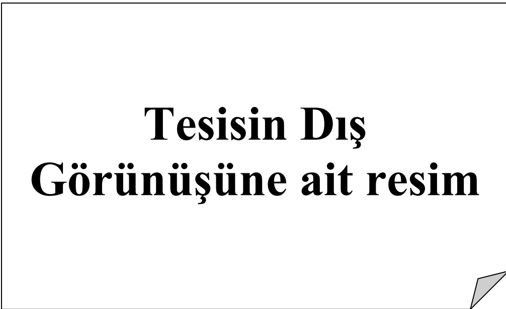
Resim 1.2 Tesisin Dış Görünüşü 2